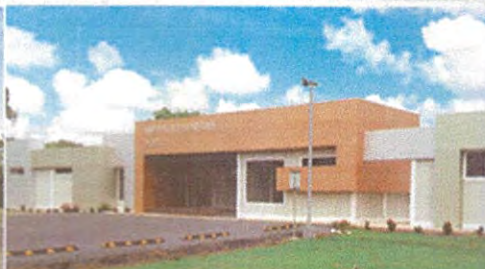
Centro de Investigación de Enfermedades Emergentes y Zoonóticas (CIEEZ), Divisa.