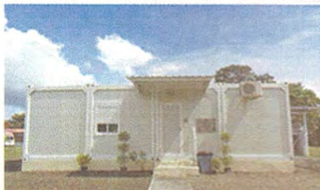
Centro de Diagnóstico de Enfermedades Desatendidas, Meteti Darién.