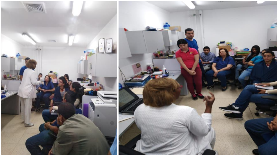
Charla sobre los Primeros Auxilios, uso del botiquín para investigadores de Entomología.