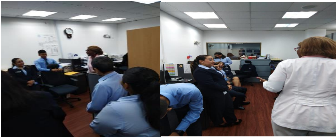
Pasaporte para una vida Saludable