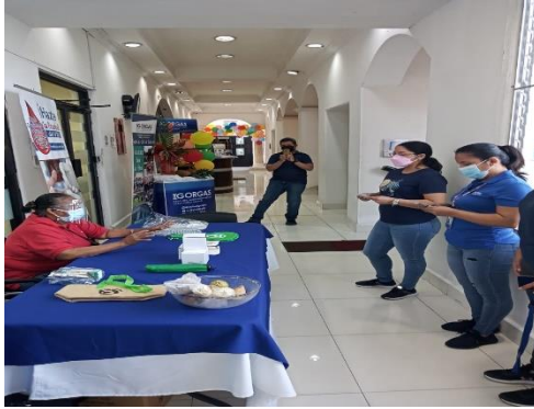
Programa de Salud Ocupacional Minsa