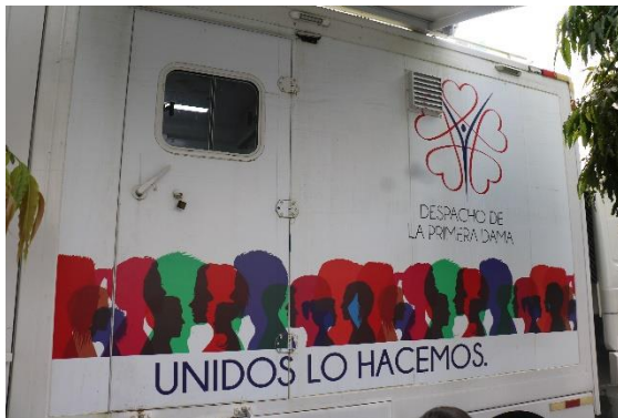
Carro móvil – Despacho de la Primera Dama