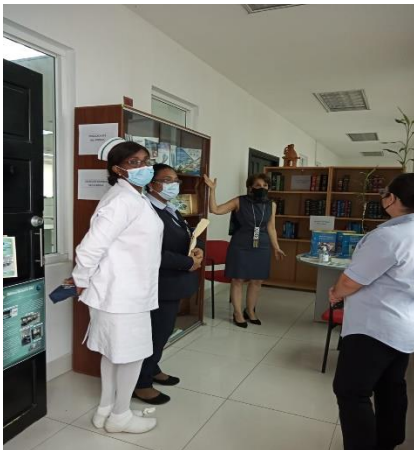
Biblioteca de la Universidad de Panamá Colección de Libros de la Biblioteca del ICGES