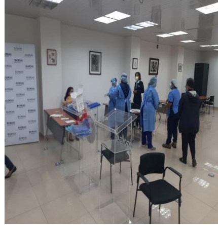
Se realizaron Hisopados antes del examen de Mamas