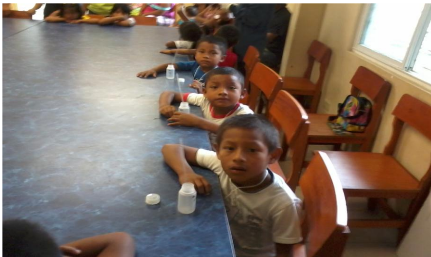
Ingestión del agua deuterada previa a la recolección de las muestras de saliva.