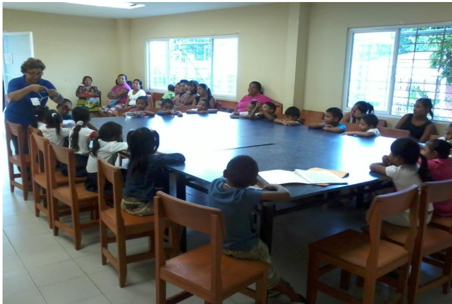
Participantes del Estudio.