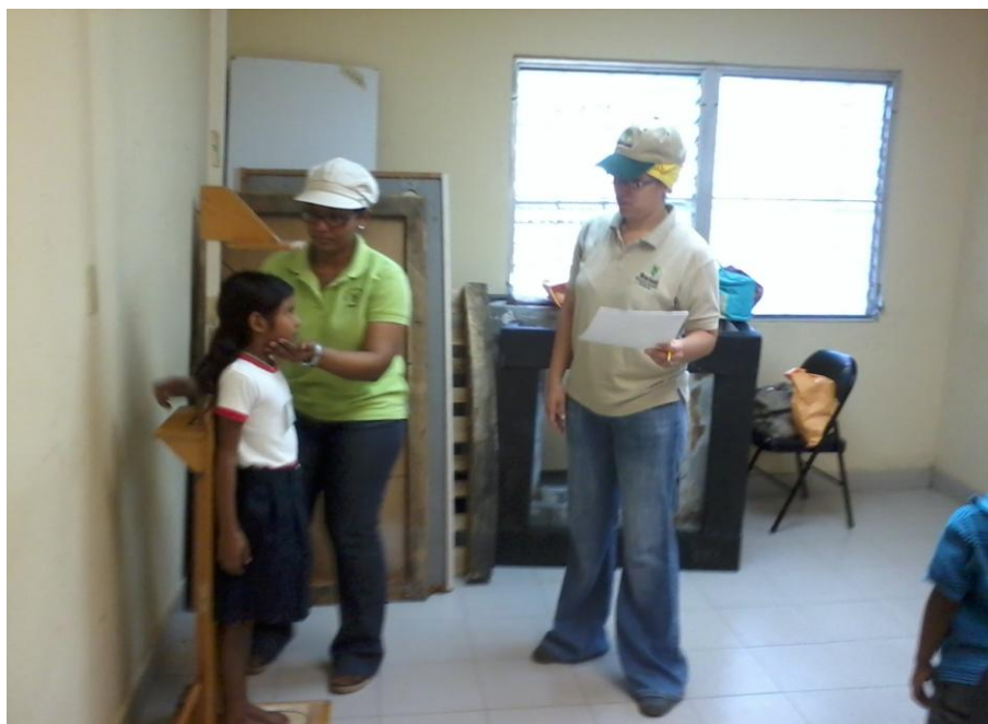
Toma de medidas antropométricas por las Nutricionistas.