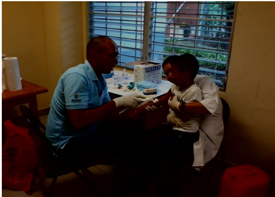
Toma de muestra de sangre a los niños por el personal de Laboratorio.