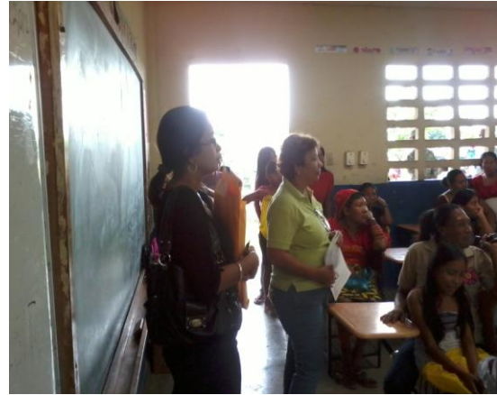
Reunión con los padres de familia para explicarles el objetivo del Proyecto.