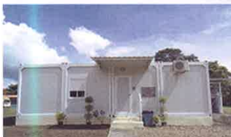
Centro de Diagnóstico de Enfermedades Desatendidas, Metetí Darién.