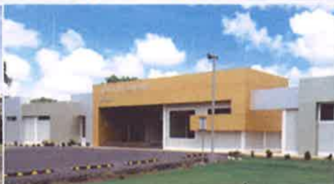
Centro de Investigación de Enfermedades Emergentes y Zoonóticas(CIEEZ), Divisa.