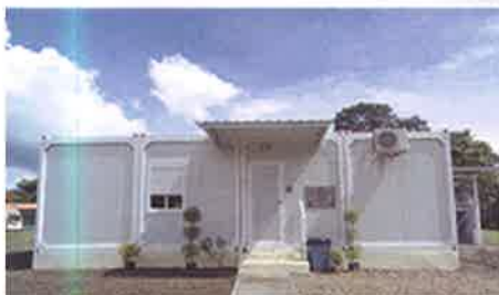
Centro de Diagnóstico de Enfermedades Desatendidas, Metetí Darién.