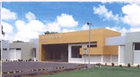
Centro de Investigación de Enfermedades Emergentes y Zoonóticas(CIEEZ), Divisa.