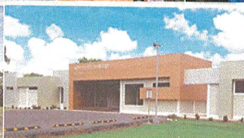
Centro de Investigación de Enfermedades Emergentes y Zoonóticas (CIEEZ), Divisa.