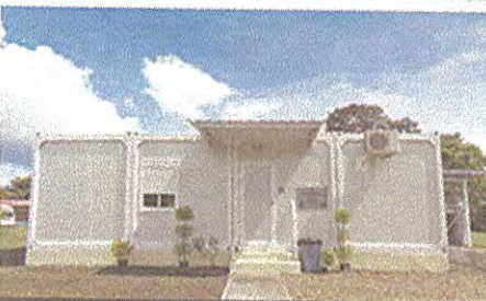
Centro de Diagnóstico de Enfermedades Desatendidas, Meteti Darién.