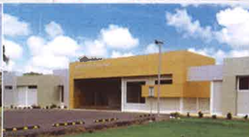
Centro de Investigación de Enfermedades Emergentes y Zoonóticas(CIEEZ), Divisa.