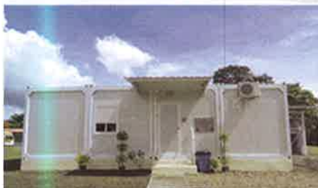
Centro de Diagnóstico de Enfermedades Desatendidas, Metetí Darién.