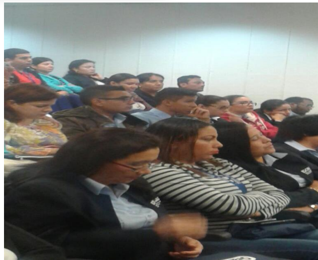
Personal del ICGES