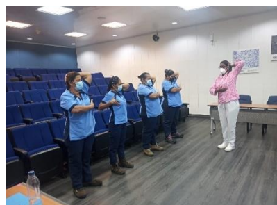
Sección de Ornato y Aseo