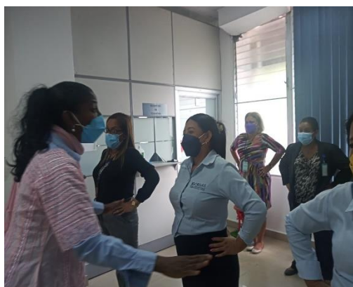
Depto. De Presupuesto

Un autoexamen de mamas es una inspección se realiza por tu cuenta. Para conocer mejor el estado de las mamas, usas los ojos y las manos para determinar si hay algún cambio en su aspecto y composición. También lo podemos realizar en casa para buscar cambios o problemas en el tejido mamario. Muchas mujeres sienten que hacer esto es importante para su salud.