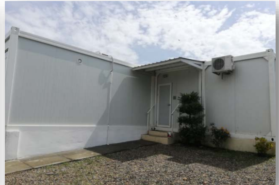
Laboratorio Modular en Metetí, Darién