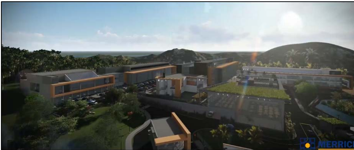
Vista panorámica del futuro "Campus Gorgas"

Por lo anteriormente descrito, es prioridad desarrollar un proyecto que brinde infraestructura y equipamiento en un nuevo Campus Gorgas, el cual estará localizado diagonal a la Ciudad Hospitalaria en la Provincia de Panamá, Distrito de Panamá, actualmente en construcción en el corregimiento Ancón, Sector de Chivo Chivo.