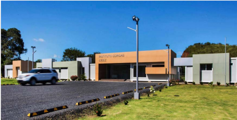
Vista general del Laboratorio Gorgas en DIVISA.