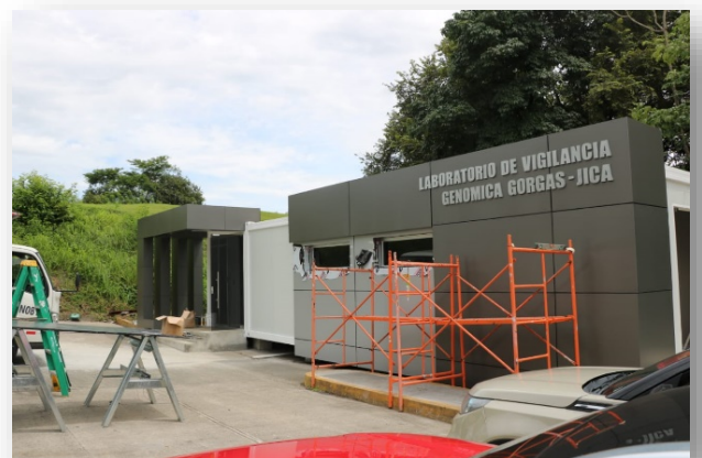
Laboratorio Modular Gorgas para COVID en Ciudad de Panamá