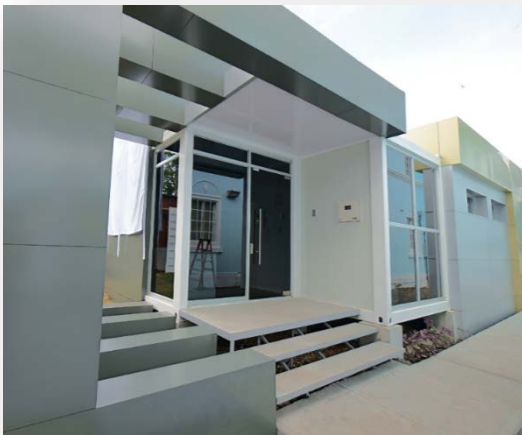
Laboratorio Modular Gorgas para COVID en Ciudad de Panamá