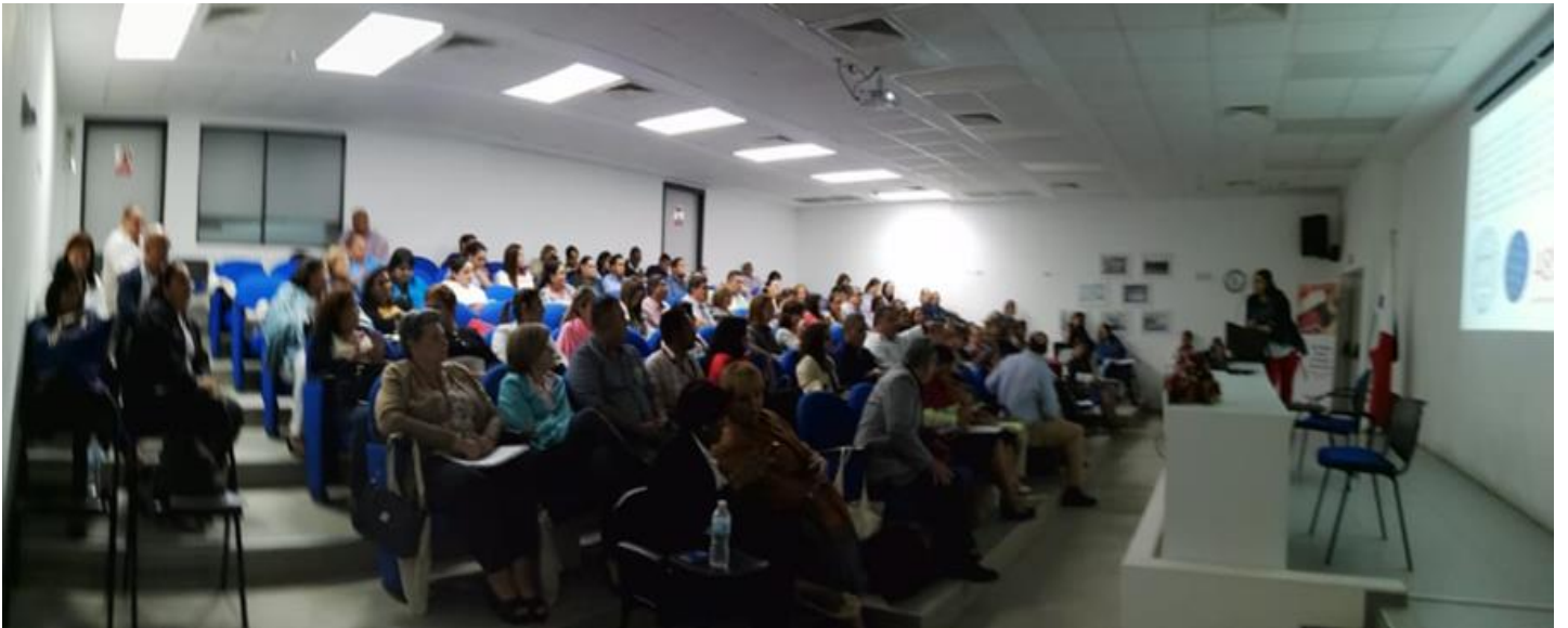
Vistas de la concurrencia