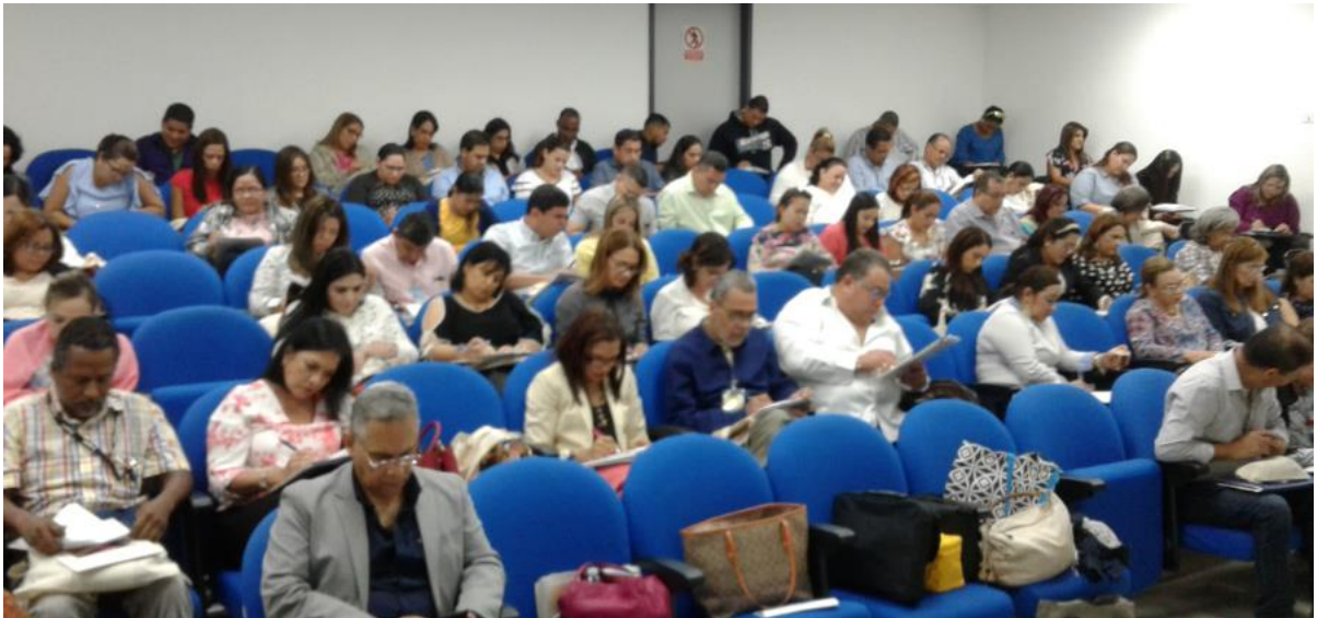
Participantes haciendo el pre-test