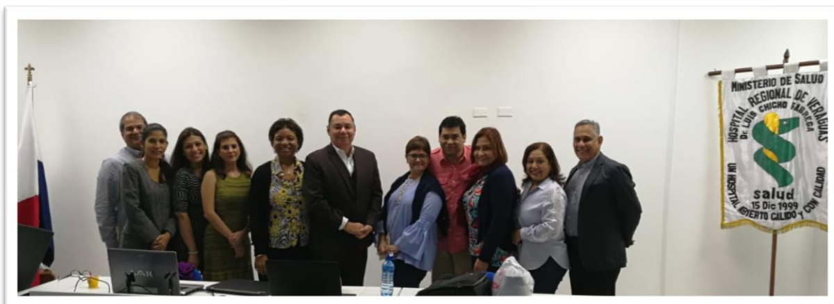
Miembros del Equipo Investigador participante en la 1ª Calibración de Examinadores de la Etapa 1 de la 2da Fase del Estudio de Cáncer Bucal en Panamá.